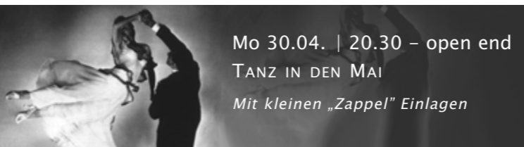
Mo 30.04. | 20.30 - open end TANZ IN DEN MAI Mit kleinen „Zappel“ Einlagen