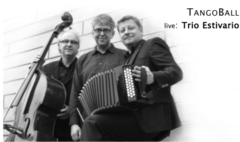
TANGOBALL live: Trio Estivario